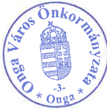
Dr. Trizsi Zsolt polgármester