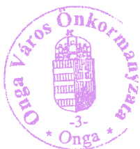
Dr. Trizsi Zsolt polgármester