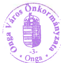
Dr. Trizsi Zsolt polgármester