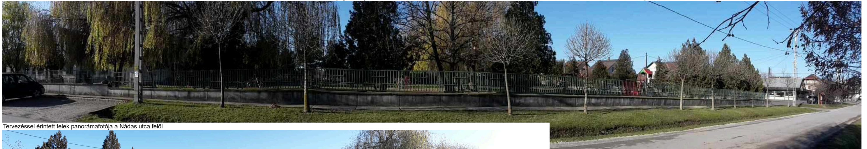
Tervezéssel érintett telek panorámafotója a Nadas utca felől