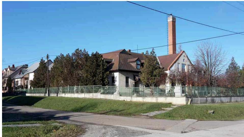
1053 helyrajzi szám alatti, szomszédos telken lévő óvoda épülete észak-nyugati irányba tekintve