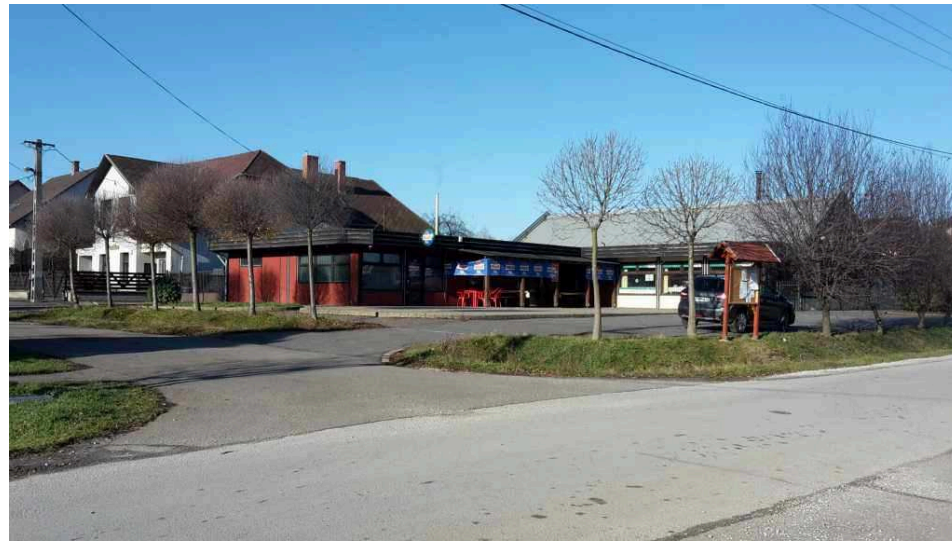
1011/4, 1011/3 alatti vendéglátó hely és élelmiszer bolt a Nadas és Bem Apó utca sarkán