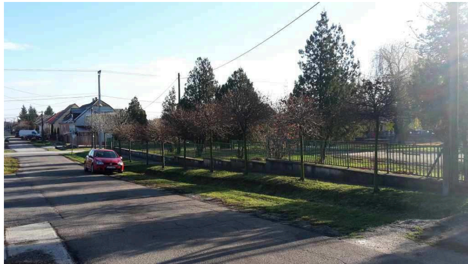
Tervezéssel érintett telek a Bem Apó utca felől észak-keleti irányba tekintve