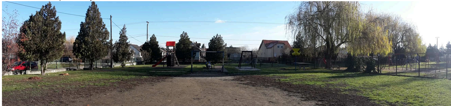
Tervezéssel érintett telek keleti irányba tekintve