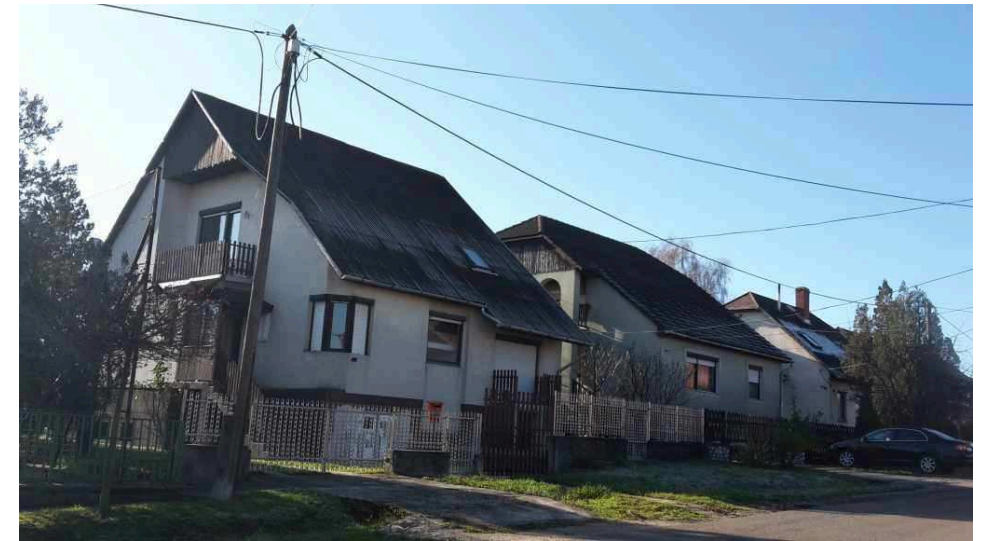
1014, 1015 alatti szomszédos telken lévő lakóházak a Bem Apó utcában