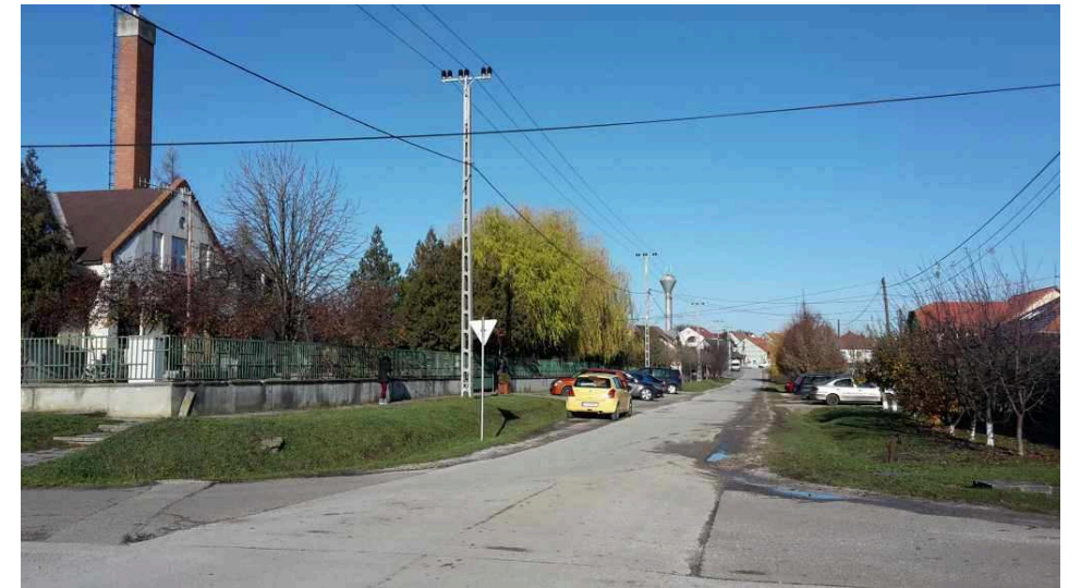
Nadas utca északi irányba tekintve